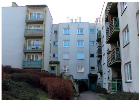
Budynek przed remontem