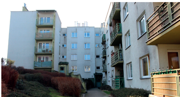
Budynek przed remontem