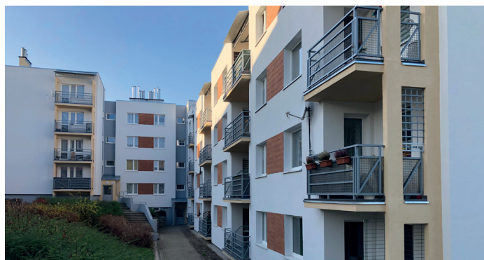
Budynek po remoncie